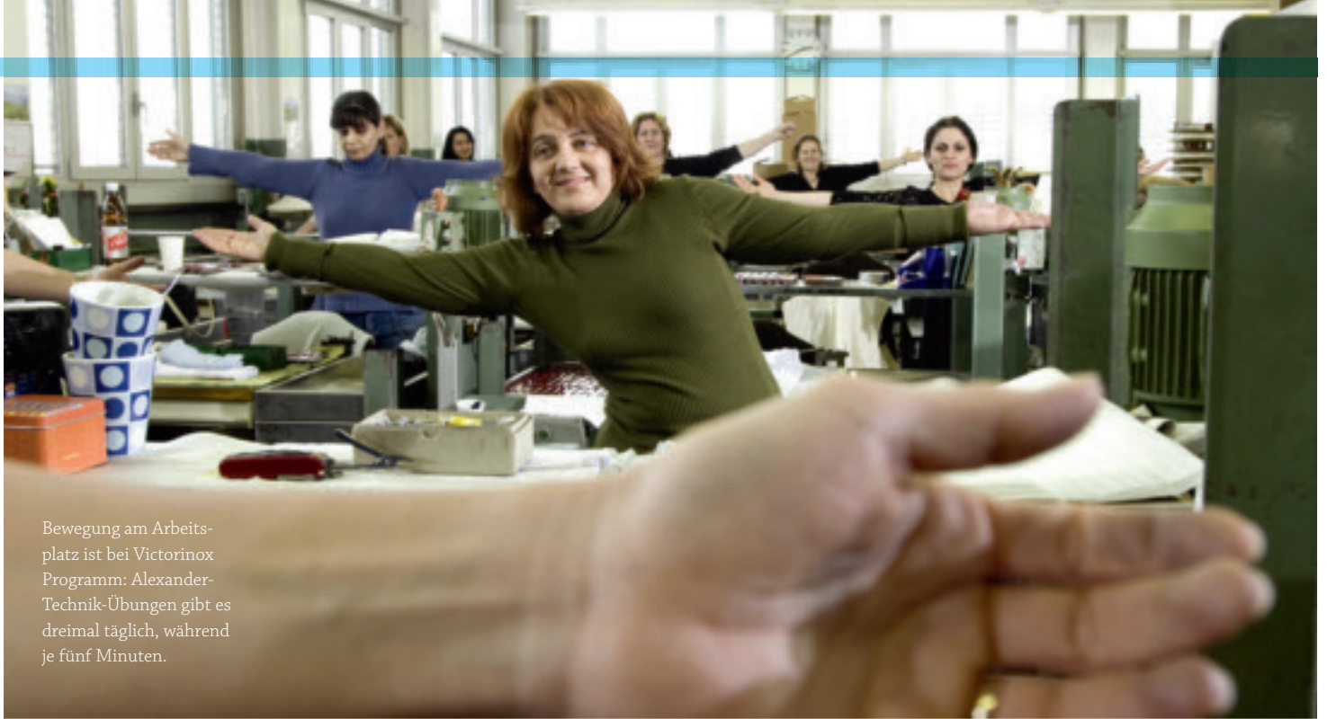
Bewegung am Arbeitsplatz ist bei Victorinox Programm: Alexander-Technik-Übungen gibt es dreimal täglich, während je fünf Minuten.

28 000 (2005) senken. Das gute Niveau von 2005 konnte seither gehalten werden.