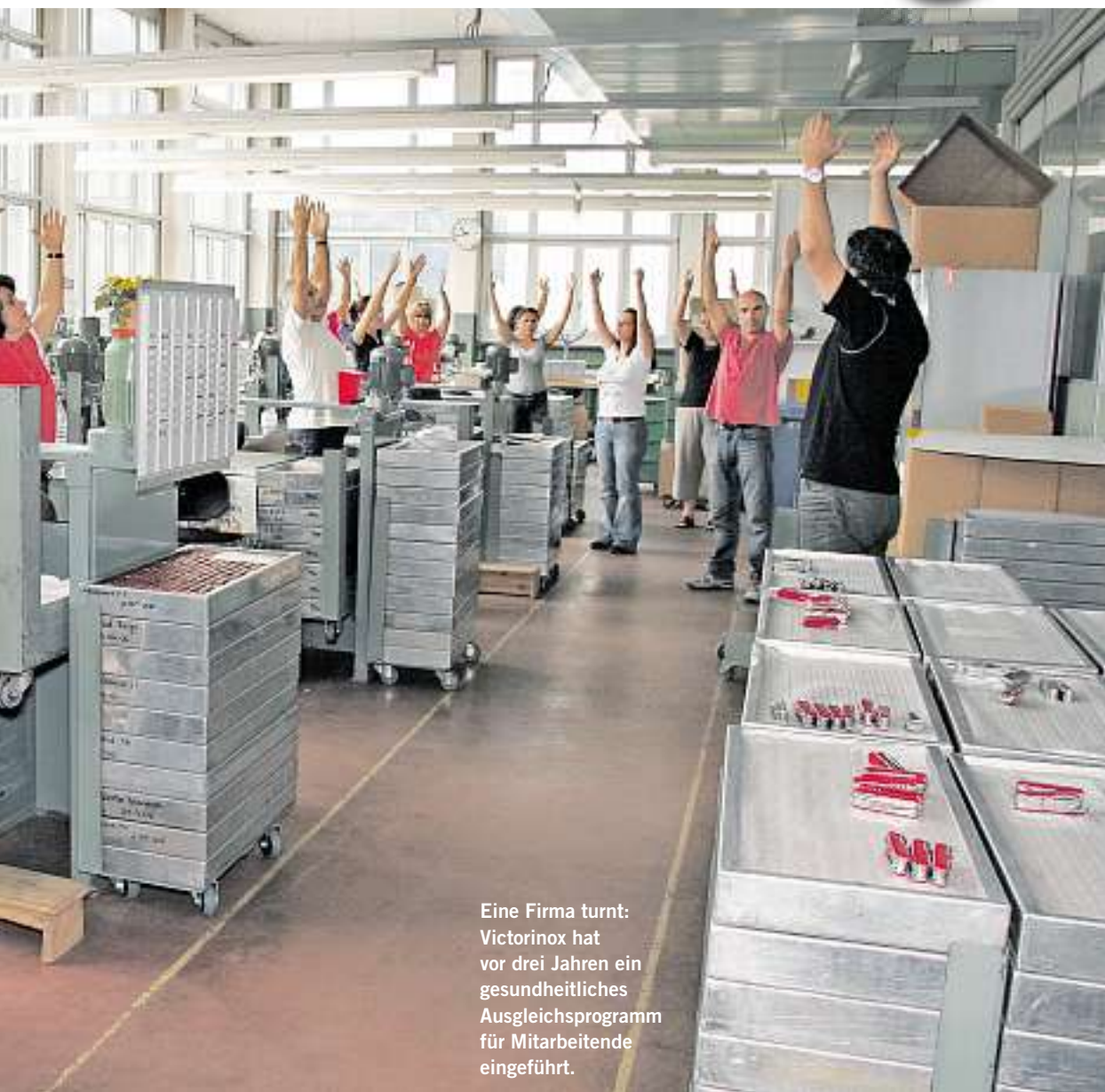
Eine Firma turnt: Victorinox hat vor drei Jahren ein gesundheitliches Ausgleichsprogramm für Mitarbeitende eingeführt.