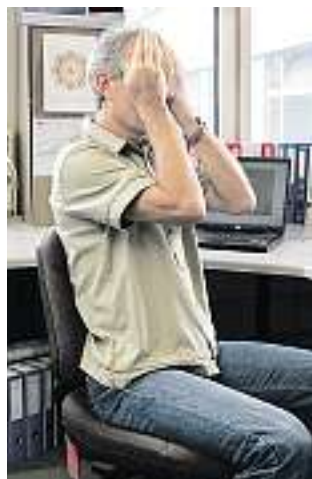
Bildschirmarbeit belastet die Augen. Einfache Tricks helfen.