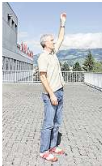
Wer viel sitzt, sollte sich regelmässig eine Auszeit gönnen.

• Richtige Körperhaltung für Stehübungen: hüftbreit stehen, mit gutem Bodenkontakt. Beine nicht durchstrecken, Gesäss lockern, Schultern entspannt sinken lassen. Arme auf der Seite hängen lassen, Kopf kann gelöst auf dem obersten Halswirbel balancieren.